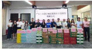
图/7月25日，广东工业设计城发动园区内企业踊跃支援北涪镇蚊媒传染病防控工作，捐赠饮用水、蚊香、花露水等物资一批（折合价约1万元）。