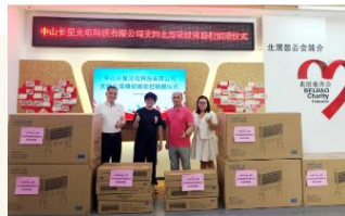
图/8月1日，中山长星光电科技有限公司捐赠大功率户外电击灭虫灯5台、户外电击式灭虫灯5台。