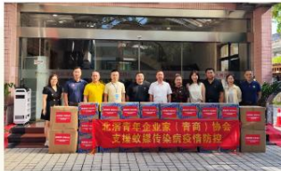
图/7月24日，北涪镇青年企业家（青商）协会积极发动会员企业参与捐赠，分别捐赠现金4.2万元以及物资1.45万元（100台中号环保灭蚊纱、300台大号环保灭蚊纱、100箱矿泉水、30箱蚊香和12000只口盅）。