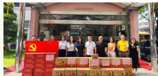
图/7月29日，中国工商银行佛山北涪支行捐赠饮用水、蚊香、驱蚊液一批（折合价约20380元）。