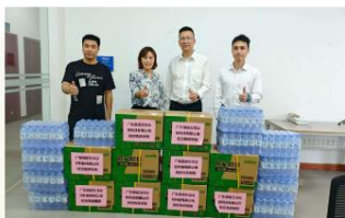
图/7月24日，广东顺德万众创科技有限公司组织员工将10箱蚊香和10件饮用水送到一线。