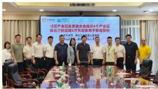
图/7月24日，顺德区产业园发展联合会主动汇聚会员力量捐赠8万元善款。