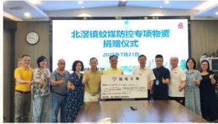
图/7月21日，北涪商协会、企业等捐赠款物超70万元。

7月20日，北涪慈善会发出《关于动员社会力量支援蚊媒传染病疫情防控工作的倡议书》社会各界积极响应，磅礴力量快速汇集，21日-31日募集款物超98万元，为防疫工作提供坚实的保障。